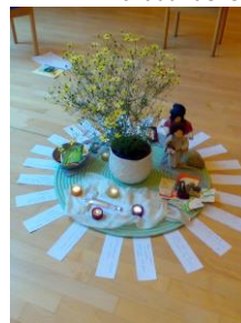
Bild vom Kurs SekretärInnen im kirchl. Dienst „Glauben vertiefen – Kommunikation verbessern“

Werdenfelser Seminarwoche im Haus Werdenfels